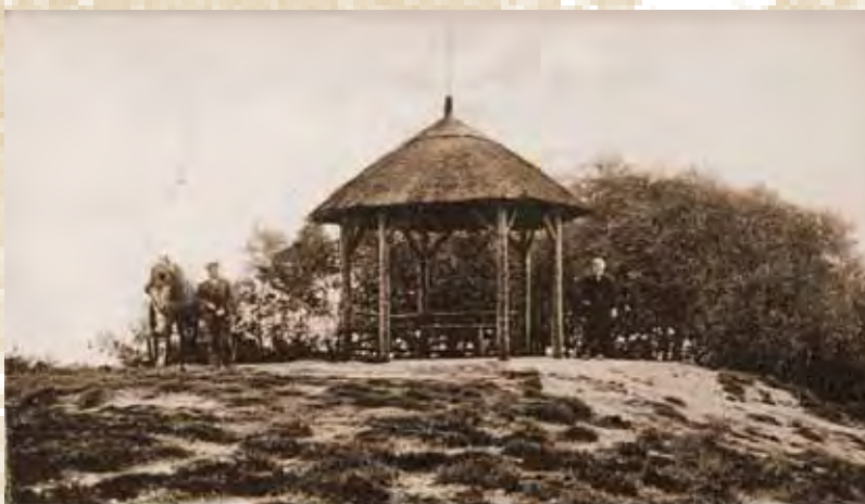
DE STEEG, — De Kaap.

“Lili,” zegt Corrie op een van de wandelingen, “er is in een van de pensions, in de Diepe Steeg, een nieuwe familie gekomen met vier meisjes.” “Ja? Hé die moesten ook meedoen.” “Neen, laten we die maar niet vragen, het zijn bokken.” “Bokken? Bedoel je dat ze niet vriendelijk zijn?” “Ja, ze hebben mij niet eens gegroet toen ik ze tegenkwam.” “Ze hebben je misschien niet gezien?” “Jawel, ze hebben me aangekeken.” “En heb jij hen wel gegroet?” “Neen, natuurlijk niet, zulke bokken!” “Maar Corrie, wat zullen ze nu van jou zeggen?” Corrie krijgt een kleur en zegt: “Moeten zij dan niet eerst groeten?” “Waarom? Daar denk ik nooit over; ik groet alle menschen en dan groeten ze altijd weerom.” “O, Lili!” fluistert Corrie eensklaps verschrikt, “daar komen ze juist aan, nu zul je zelf wel merken dat het bokken zijn”.